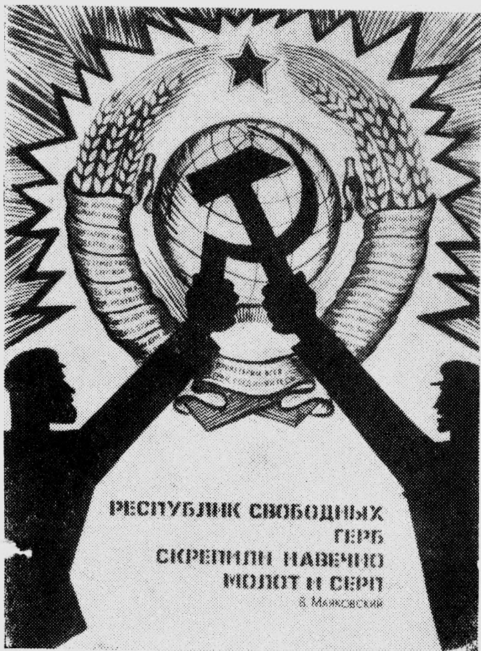
Художник Е. Вероградов.